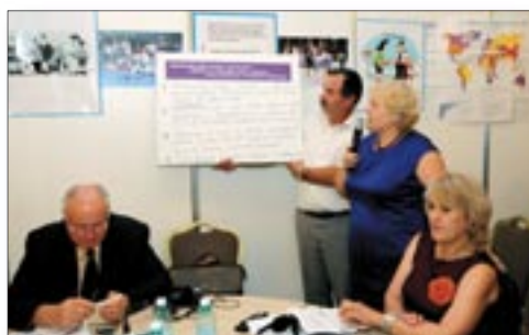
Launch of Women in Politics project.

Boosting women's political participation and decision-making is fundamental for democracy and essential for achieving sustainable development in Moldova was the conclusion reached by participants taking part in an event organized by the United Nations in Moldova, the Embassy of Sweden and civil society organisations on July 4, 2014.