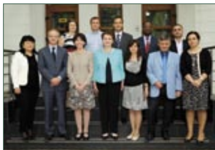
UN Country Team in Moldova.

As we take stock of one year of operation of the Government of the Republic of Moldova-UN Partnership Framework 2013-2017, we note that Moldova has made significant progress in implementing its modernization agenda, underpinned by its strategic EU integration commitments and achieving the Millennium Development Goals by their 2015 deadline.