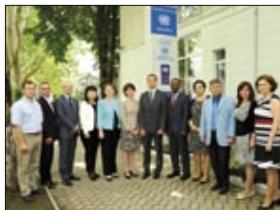
Echipa de țară a ONU în Moldova.

Bilanțul primului an de acțiune al Cadrului de Parteneriat dintre Guvernul Republicii Moldova și Organizația Națiunilor Unite pentru anii 2013-2017 relevă că Moldova a obținut un progres semnificativ în implementarea agendei sale de modernizare, susținută de angajamentul strategic de integrare în Uniunea Europeană și de termenul final pentru atingerea Obiectivelor de Dezvoltare ale Mileniului – anul 2015.