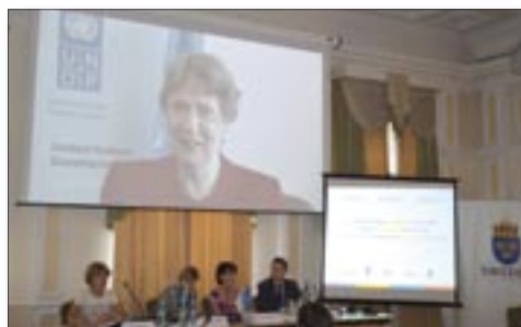
Lansarea programului „Femeile în politică în Moldova”.

Programul „Femeile în politică în Moldova” va fi implementat în perioada 2014-2016 cu un buget de 2,9 milioane dolari SUA oferit de Guvernul Suediei și implementat de Agențiile ONU – UN Women și PNUD în parteneriat cu Fundația Est-Europeană și Centrul Parteneriat pentru Dezvoltare.