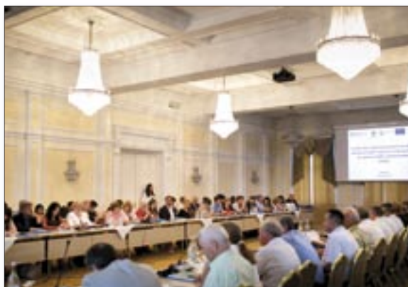
National conference with the key national stakeholders on the results of the first national STEPS survey.

The Ministry of Health and World Health Organization (WHO) with donors support jointly presented the results of the first STEPS study on the prevalence of non-communicable disease risk factors in the Republic of Moldova during a national conference in June 2014.