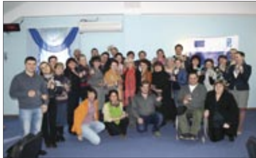
Crearea platformelor de interacțiune dintre reprezentanții sectorului asociativ și experții din domeniul economic de pe ambele maluri ale Nistrului este o inițiativă a Programului „Susținerea Măsurilor de Promovare a Încrederii”.

Acesta este doar unul din cele patru proiecte care au luat naștere și au fost finanțate ca urmare a unei inițiative a Programului UE-PNUD de promovare a încrederii, focusată pe crearea unor platforme de comunicare între experții din domeniul economic și reprezentanții societății civile de pe ambele maluri ale Nistrului. Platformele de comunicare în domeniile economie/comerț și social/umanitar au întrunit peste 100 de experți de pe ambele maluri ale Nistrului, care în decursul unui an au discutat în grupuri de lucru problemele comune ale oamenilor de pe cele două maluri ale Nistrului și au identificat împreună posibilele soluții pentru depășirea lor. Propunerile identificate vor fi prezentate comunității donatorilor, pentru ca acestea să devină, în următorii trei ani, proiecte de consolidare a încrederii în vederea îmbunătățirii vieții oamenilor pe ambele maluri ale Nistrului. Experții au mers împreună în