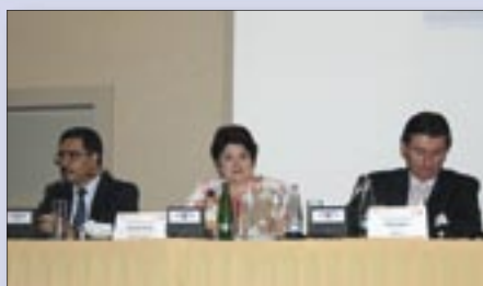
Minister Valentina Buliga: "The meeting was a good platform for discussion and experience exchange..."

The new evidence and policy realities for countries in the region need to be included in the global ICPD and post 2015 agenda as well as set future tasks to be implemented at national level.