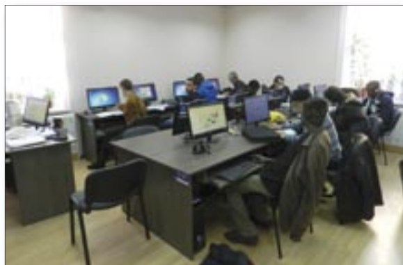
Refugees in Moldova are studying Romanian in the language labs equipped by UNHCR with EU funds.

The event was hosted by the “Ion Creanga” State Pedagogical University which is UNHCR Moldova’s operational partner. UNHCR has established a fruitful collaboration with the university a couple of years ago, where some 90 refugees and asylum seekers attended Romanian language classes using two language laboratories which were renovated and