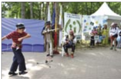
World Refugee Day 2014 in Moldova.

On June 20, World Refugee Day is marked all over the world to remember the millions of refugees and other forcibly displaced people. The UNHCR Global Trends report released on June 20, said that the number of refugees, asylum seekers and internally displaced around the world, for the first time exceeded 50 million people since World War II.