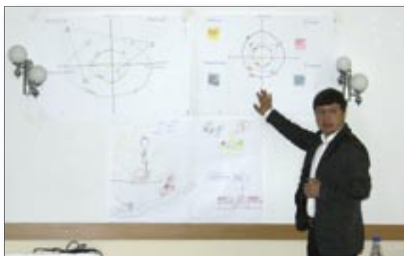
Romanian experts train Moldovan specialists on the use of regional statistics in developing local and regional plans.

Recent products by the Project include the publication “Territorial Statistics, more than 100 regional statistical indicators in the NBS data bank, and a module for visualizing regional statistics in the form of electronic maps which are available at www.statistica.md