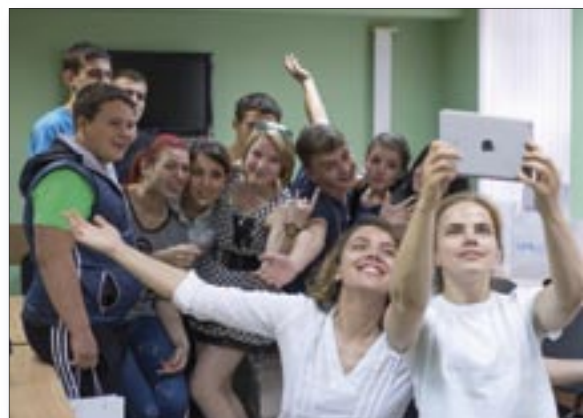
Happy teenagers at the end of the OneMinutesJr. Workshop in Balti.