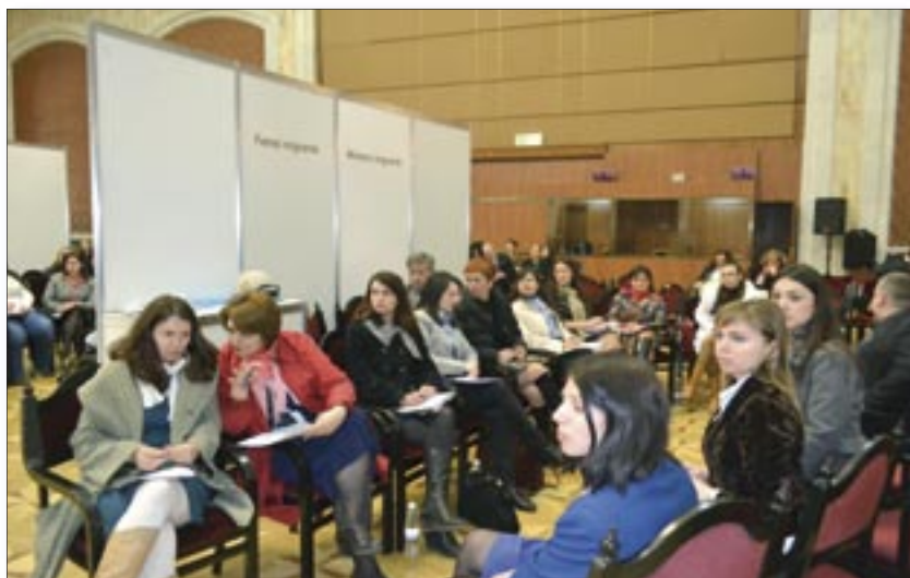
Migrant women contribute to the country's development.

The forum was organized with the support of UN Women, UNDP and IOM Mission in Moldova.