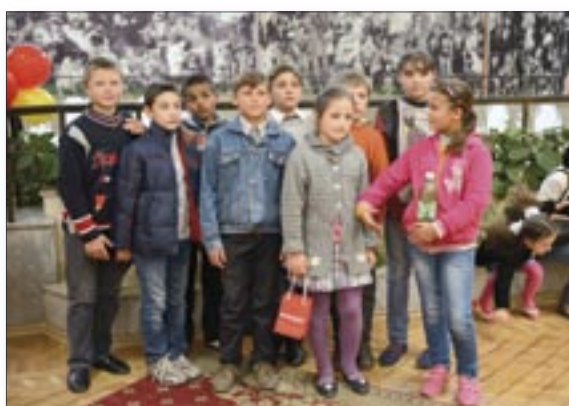
Children at the puppet theatre for children – Licurici – in Chisinau.

The children’s outing was organized by the Youth Media Centre, with the support of UNICEF Moldova and the Ministry of Culture, as part of a series of events dedicated to International Children’s Day.