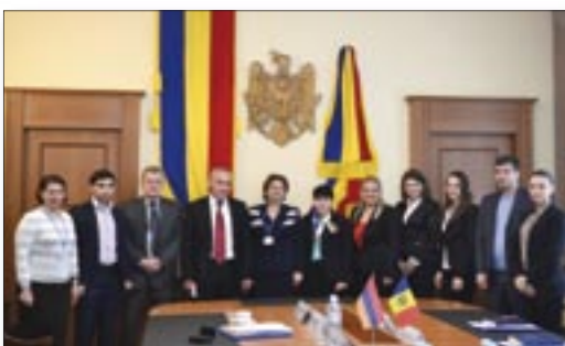
O delegație a oficialilor armeni s-a aflat într-o vizită de studiu în Republica Moldova pentru a cunoaște experiența țării noastre în domeniul gestionării readmisiei.

Vizita oficialilor armeni la Chișinău a fost organizată în cadrul Proiectului regional „Sprijinirea instituirii unui management eficient de readmisie în Armenia, Azerbaidjan și Georgia”, finanțat de către Comisia Europeană în cadrul programului tematic de cooperare cu țările terțe în domeniul migrației și azilului și co-finanțat de Fondul de Dezvoltare OIM.