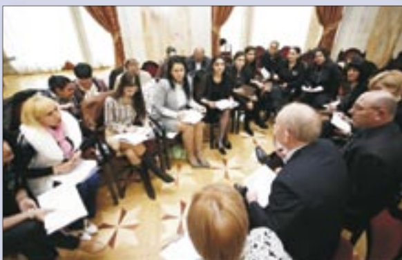
Forumurile publice „Parteneriat pentru o Moldova incluzivă și prosperă” au demonstrat că în Republica Moldova femeile contează.

La cele două forumuri publice „Parteneriat pentru o Moldova incluzivă și prosperă” și „Femeile contează”,