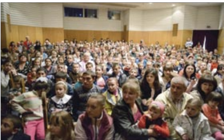
Sala de spectacole a Teatrului Republican de Păpuși „Licurici” a găzduit, cu ocazia zilei de 1 iunie, aproximativ 280 de copii din regiunile țării.

Evenimentul a fost organizat de Centrul Media pentru Tineri, cu sprijinul UNICEF și al Ministerului Culturii, ca parte a șirului de activități dedicate Zilei Internaționale a Copiilor.