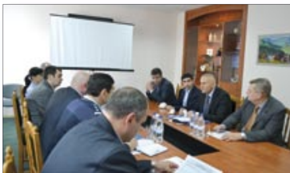
Armenian officials learn about Moldova's experience in cooperating with the EU on migration and asylum issues.

Prior to the exchange programme, on April 14-15, 2014,