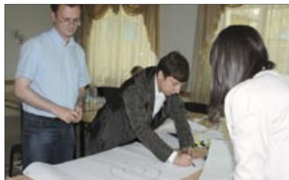
Datorită acestui atelier de lucru specialiștii moldoveni în dezvoltare regională știu mult mai bine cum să folosească datele statistice.

„Până nu demult, ca să obținem indicatori regionali agregați, trebuia să colectăm date de la fiecare raion în