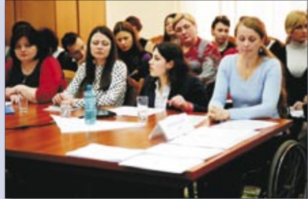
"Partnerships for an Inclusive and Prosperous Moldova: Women Matter!".

During these meetings, women voiced out their views on the current and future development priorities of the country, and made proposals concerning more participation of women in politics at the central and local levels. The public forums "Women Matter!" were unique and the first of this kind, allowing direct interaction between women from different groups.