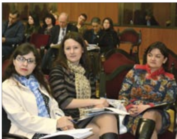
Femeile migrante și-au prezentat reușitele și problemele în cadrul forumului public „Parteneriat pentru o Moldova incluzivă și prosperă: femeile contează!”.

Femeile migrante se confruntă cu diverse probleme aici și peste hotare. Ele se integrează mai dificil, astfel încât șase din zece femei după revenirea în țară nu se încadrează în câmpul muncii. Situația se explică prin limita de vârstă, arată un studiu ILO. De asemenea, nerecunoașterea actelor de studii și calificărilor obținute în Republica Moldova de către autoritățile din țările de destinație determină o angajare la munci necalificate și o angajare discriminatorie.