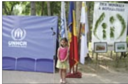
Ziua Mondială a Refugiatului a fost marcată, la 20 iunie 2014, în Republica Moldova prin mai multe acțiuni cu participarea partenerilor și comunității refugiaților.

Cu susținerea UNHCR și a partenerului său de implementare, Centrul de Caritate pentru Refugiați (CCR), Direcția Azil și Integrare, Biroul Migrație și Azil au organizat, la 19 iunie 2014, ziua ușilor deschise la Centrul Temporar de Cazare (TAC). Solicitanții de azil care locuiesc acolo au participat la diverse competiții și au povestit vizitatorilor istoriile lor. Ei au adus mulțumiri reprezentanților Guvernului